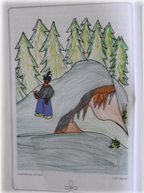
3. miesto na krajskej súťaži „Môj slovenský športový idol“ (r. 2015)